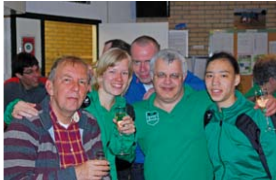
Kampioensteams voorjaar 2011: van boven naar beneden GTTC4, GTTC7 en GTTC1

Eerst is het tijd voor het jubileum. Op 3 september gaan we dat verder vieren. Met een jubileumtoernooi en een jubileumfeest. Daarover horen jullie meer.