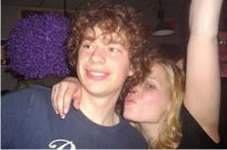
Veels te mooie meisjes vind je op het EDR...

vernieuwd hilarisch verbaal geweld. Nu wil ik niet populistisch overkomen en de sport verkopen aan de duivel met randzaken die er niks mee van doen hebben maar... spice it up a bit! Het mag een beetje mensen, een heel klein beetje. Misschien wordt het dan de clubsport wel eigen en speelt het met die extra sfeer wat meer zichzelf in de kijker.