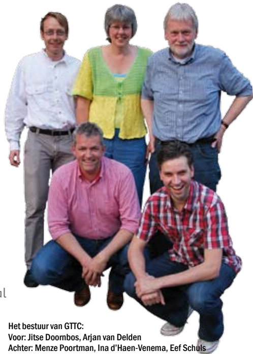
Het bestuur van GTTC:

Daarbij wordt betrokkenheid verwacht; de bereidheid om iets voor de vereniging te doen.