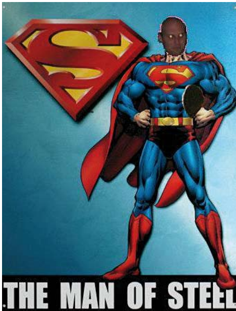
Rudger, de supersub

In ons toch rijkelijk belegd tafeltenniswereldje mag van mij dan ook wel wat meer leven in de brouwerij komen zo de potentie vervuld wordt en nieuwe leden worden aangetrokken. Ik vind melodramatisch theater ondraaglijk ook al zondig ik bijna na elk verloren punt, maar waar is de oprechte creativiteit en de spontane humorbevlieging? Waar zijn de originele doch niet kwetsende scheldpartijen en de razende emoties die in al onze tafeltenniszielen huist? De odes en de vervloeking en aan het adres van de tafeltennisgoden in het algemeen. Ik wil bijvoorbeeld quotes horen als: "Krijg nou tietten!" en "Zo zijn we niet getrouwd!" bij elke rand- en netbal tegen. Aan de andere kant mag de euforie na een gewonnen punt ook geuit worden op een droge en brave manier: "Yahtzee!", "Sapperdeflap!" of "Ik moet nu heel nodig naar de wc!" Maar de leukste zijn nog wel de politiek actuele uitspattingen: "Alle Kaddafi's nog aan toe!" en "Dat verspeelde punt is zo duur als een Engels koninklijk huwelijk!" Het lijkt me ideaal om de akoestiek te testen van de nieuwe zaal met