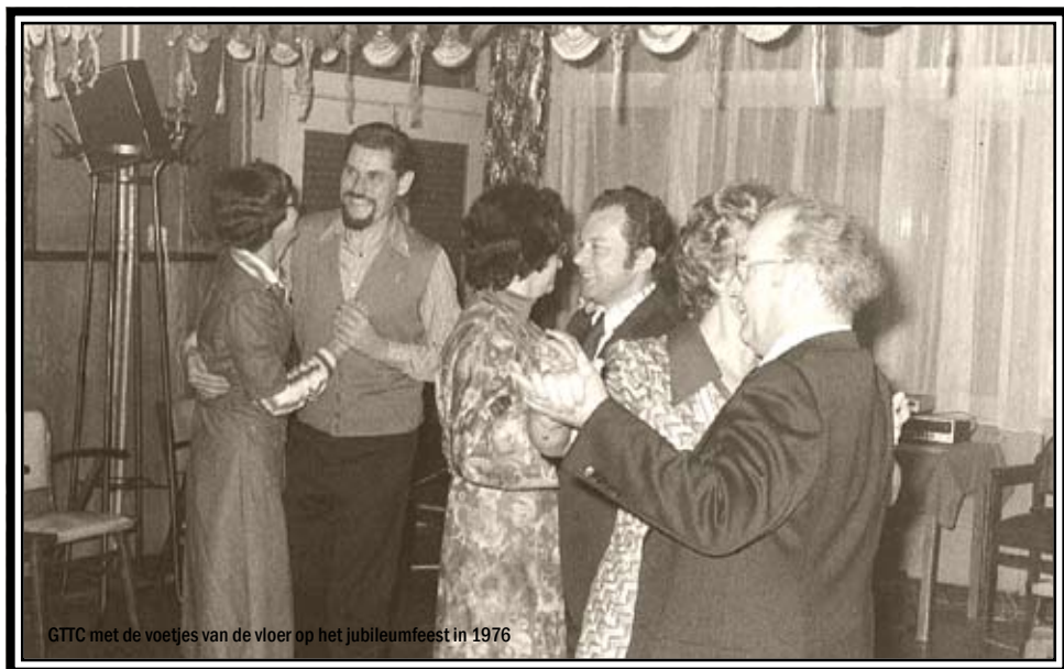
GTTC met de voetjes van de vloer op het jubileumfeest in 1976

Graag gedaan en misschien doe ik nog wel mee aan het jubileumtoernooi.