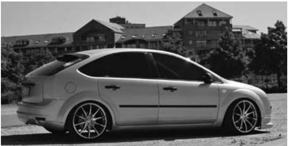
Vervoer voor Heren 1: Ford Focus met geblindeerde ramen, sportstuurkje en 19 inch velgen, van een oud dametje geweest.