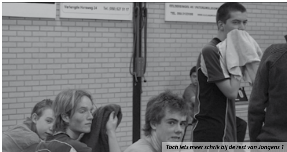
Toch iets meer schrik bij de rest van Jongens 1