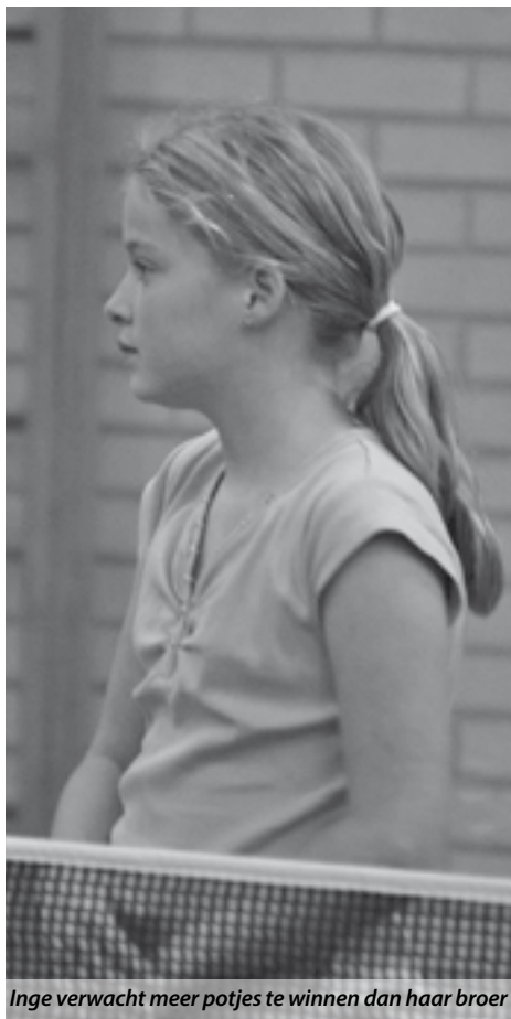
Inge verwacht meer potjes te winnen dan haar broer