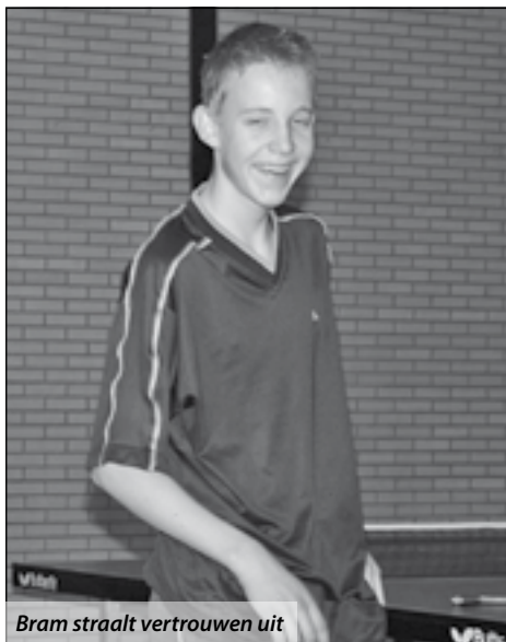
Bram straalt vertrouwen uit

Hoewel "elk nadeel z'n voordeel heb" want je komt er tenminste mee in de Ratel, zou ik me kunnen voorstellen dat je als echte GTTC'er positieve energie uit wilt stralen. Als de wedstrijd even tegenzit en de emotie je teveel dreigt te worden, kan je in plaats van GVD ook oliebol roepen. Het voordeel is dat de tegenstander van jouw ongebruikelijke reactie in de war raakt en jij meewerkt aan de positieve identiteit van GTTC.