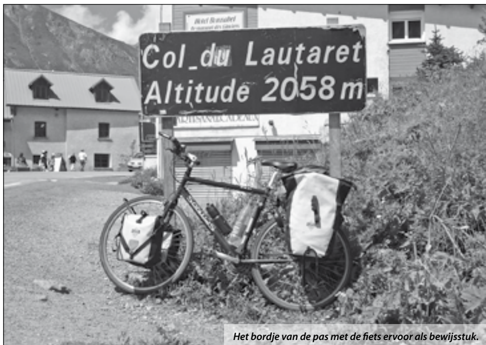
Het bordje van de pas met de fiets ervoor als bewijsstuk.

Op een andere manier ben ik de tafeltennisport iets minder trouw. Zelf zie ik het niet helemaal als vreemdgaan, dat doe je in mijn ogen eigenlijk alleen