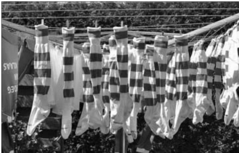
Stilleven aan de lijn bij moeder Meints.

Veel GTTC'ers spelen in een zomeravondvoetbalteam (zie www.kroegvanklaas.nl ), zo ook Wiljon. Wij ontvangen het volgende stukje: