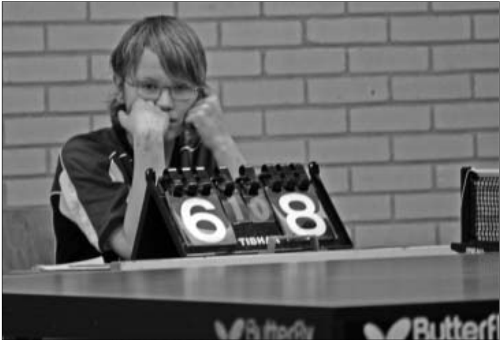
Tadgio lijkt meer oog voor de camera te hebben dan voor de wedstrijd.