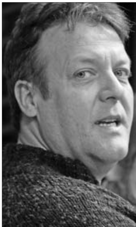
Jan heeft rust nodig.