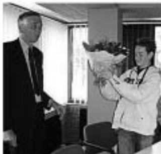
Voorbeeld van een mooi artikel over Nathan.