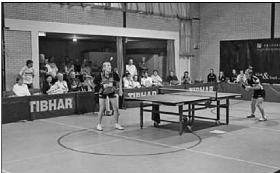
Tafeltennis op eredivisie-niveau in de zaal: veel publiek op de geïmproviseerde tribune.

liep via een reguliere competitie van 8 teams, waarvan dus 4 naar de playoffs zouden gaan.