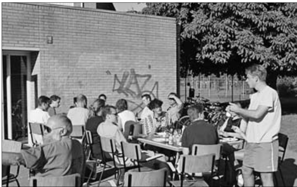
Een grote opkomst bij de barbecue!