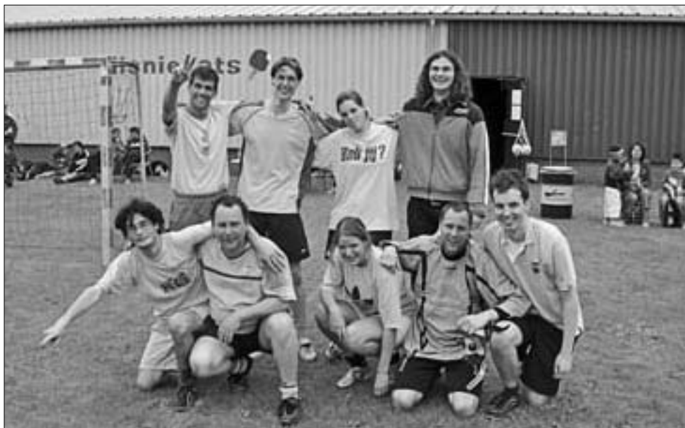
GTTC 3: goed in penalty's

Dan de "ene" poule, in mijn (misschien wel subjectieve) ogen een sterkere poule dan de