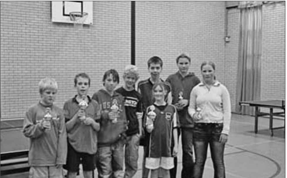
Alle winnaars van het jublieumtoernooi