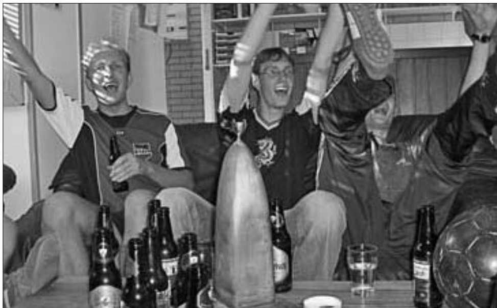
De derde helft

over een Duitse mentaliteit te beschikken. Na een voorzet over rechts kwam 'Das blaue Phantom' los van onze verdediging en verschalkte onze keeper met een beheerste schuiver in de verre hoek.