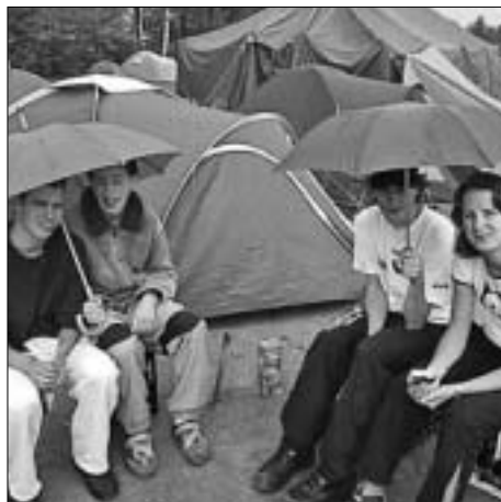
Zomer in Holland...