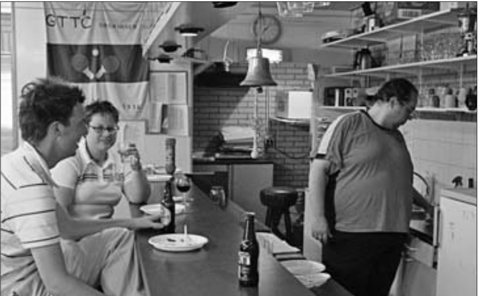
Voor de koukleumen was er ook in de kantine vertier