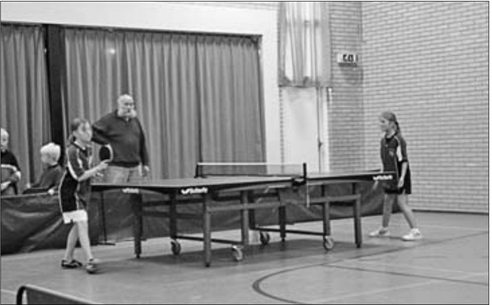
Jan let op of er niet illegaal geserveerd wordt