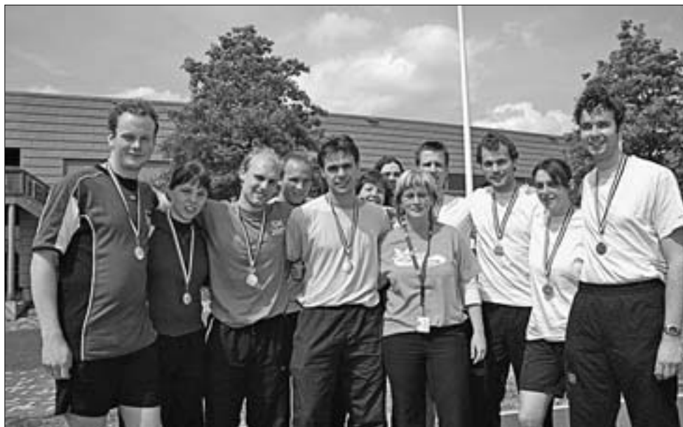
Geen geld, wel vetleren medailles

De aankomst in Nijmegen was veelbelovend. Een in eerste instantie lege legertent vulde zich al vrij snel met de dames basketbalselectie. Maar zelfs met de garantie dat we toch alles zouden winnen, wilde geen van allen de basket verruilen voor een lager hangend netje. En dat terwijl achteraf bleek dat het team een authentieke Wiersma in de gelederen had! Gelukkig had-