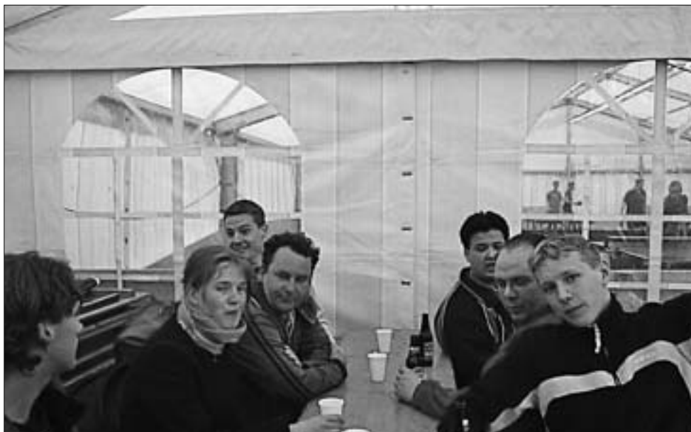
Ook op een zwartwit foto is een duidelijk onderscheid te maken tussen de groenen en de blauwen