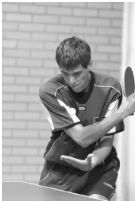
JWW: liever twee linkerhanden!