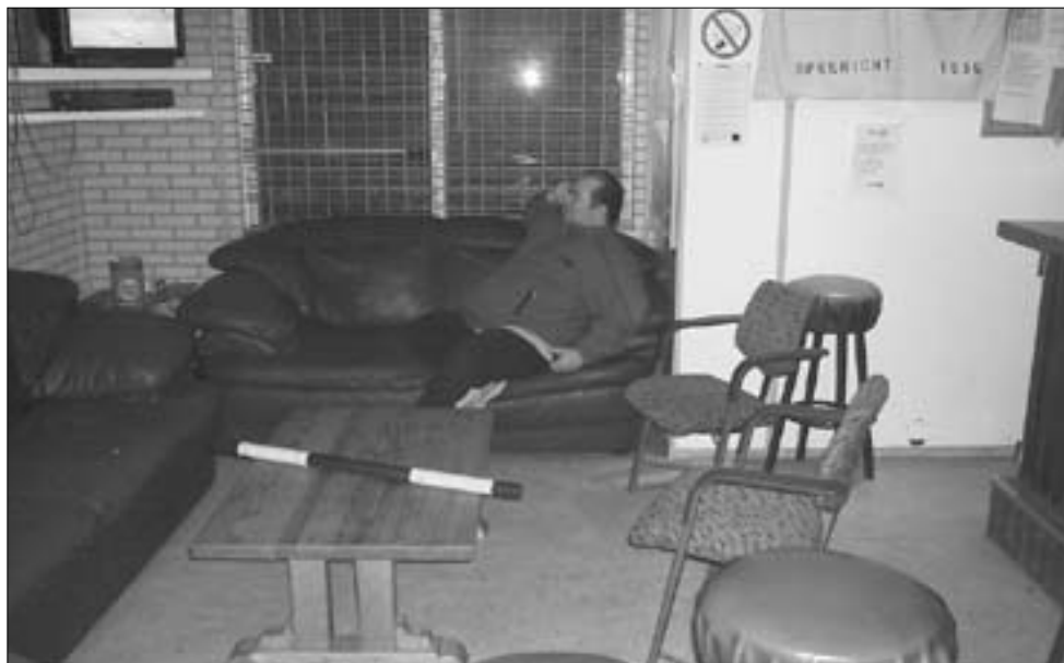
Tjaart gaat weg en blijft toch.