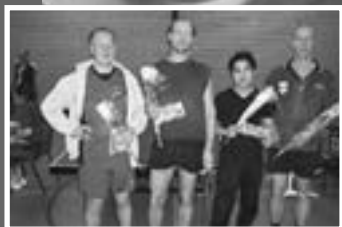
15 Heren 12 kampioen

Indien onbestelbaar: van Starckenborghstraat 67 9721 EB Groningen