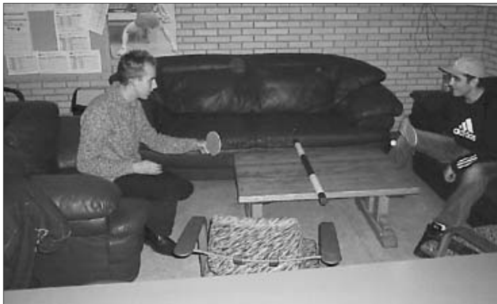
De kantine biedt vele vormen van vermaak!

Zoals de meeste mensen reeds zullen weten zal Tjaart per 31 december de club als werk-