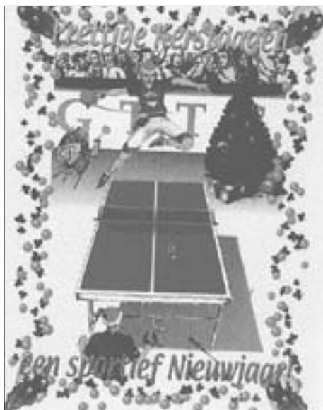
Alvast kopen die kaart!!