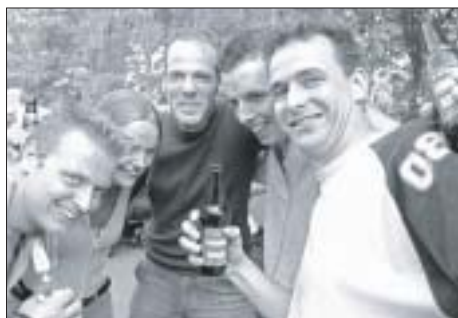
Gezelligheid troef tijdens het EDR