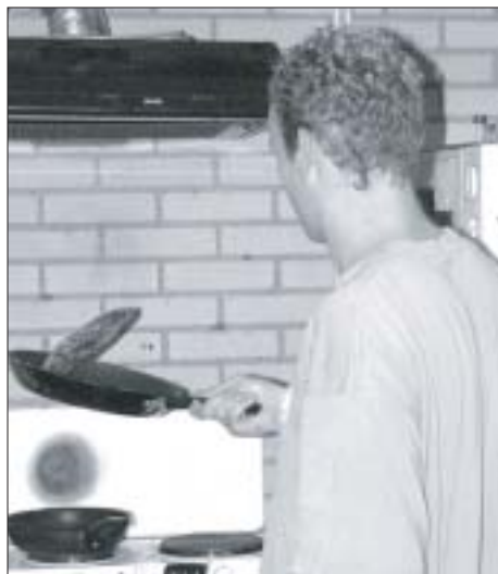
Mark bakt ze bruin