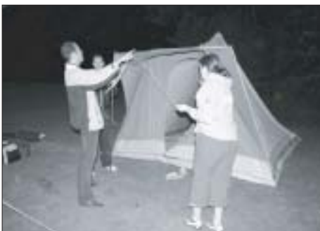
Rik is tentenopbouwdeskundige (EDR)