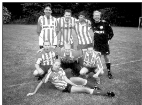
GTTC 2: VfB Stuttgart