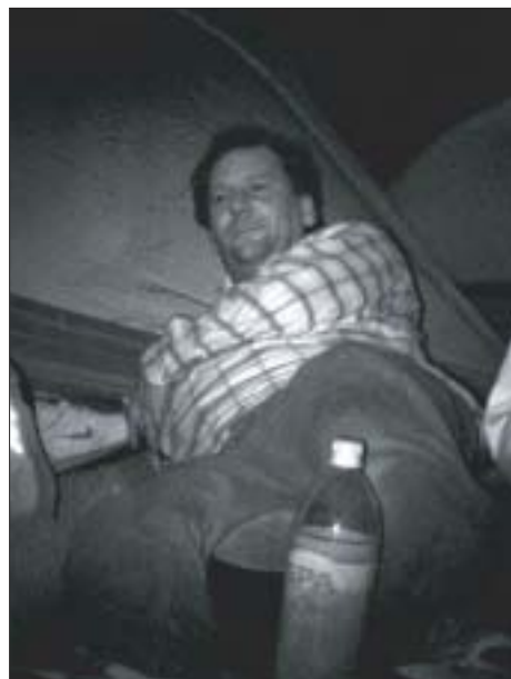
.....uw voorzitter iets minder....