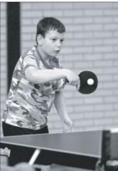
Borach leert verdedigen

Vorig seizoen kwamen ze nog uit in de 4e klasse, maar daar bleken ze het toch wel wat te makkelijk te hebben. Vooral omdat deze jonge mannen regelmatig in de GTTC-zaal te vinden zijn en hard trainen, zullen ze