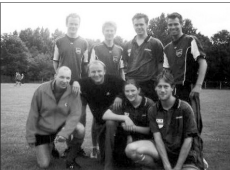
GTTC 1: Eintracht Groningen

Wie zegt dat tafeltennissers niet kunnen voetballen heeft het niet bij het juiste einde! Dat kunnen ze zeer goed, of althans een aantal binnen onze club. Er is namelijk een fanatiek clubje binnen onze vereniging dat elke zondag in het Stadspark gaat voetballen. (interesse: vanaf volgend voorjaar/zomer gaan ze vast wel weer)