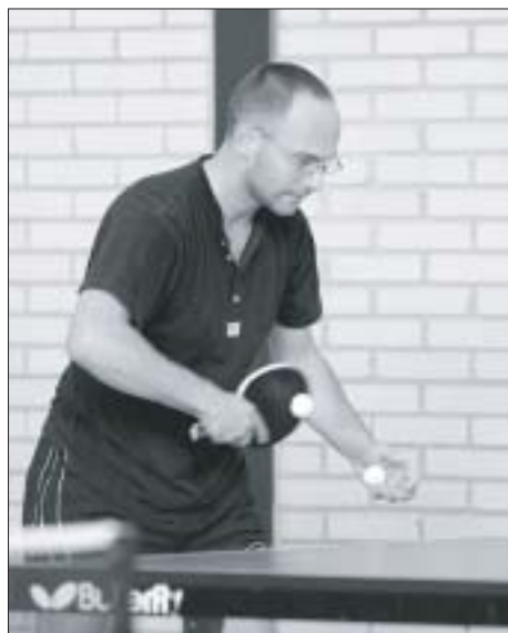
Een speler uit Down Under demonstreert dat je tafeltennis gemakkelijk met 2 ballen kunt spelen