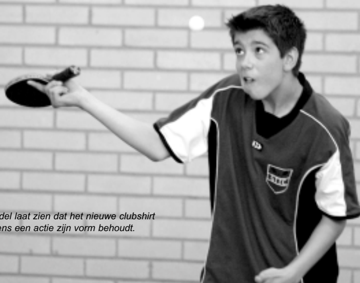
Een model laat zien dat het nieuwe clubshirt ook tijdens een actie zijn vorm behoudt.

1 januari 2005 alleen competitie in het nieuwe shirtle.