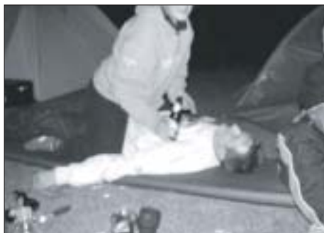
Reanimatie voor een uitgeputte deelnemer (EDR)