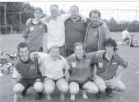
GTTC 3: FC Schweinfurt Siegen

Team 1 had een titel te verdedigen. Dat dit lastig kon worden, was wel duidelijk. Dit team had er een sterke concurrent bij gekregen in de vorm van de andere GTTC teams en dan vooral team 2. Ze begonnen tegen team drie, wat al meteen een lastige pot was, maar