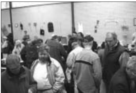
Kijkers of kopers?

hadden daar de eerste twee uur dan ook hun handen vol aan. Daarna werd het rustiger. Toen om 16.00 uur de rommelmarkt gesloten werd, bleek de opbrengst 792 euro te zijn. Geen recordbedrag, maar toch zeker een welkome opbrengst.