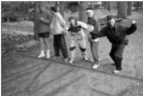
Start van de sponsorloop.

sponsors. Ook zal er weer een rommelmarkt gehouden worden.