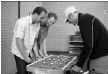
Somige spullen werden getest op hun bruikbaarheid.

Dat de rommelmarkt elk jaar weer een succes wordt, is vooral te danken aan de inzet van menig GTTC-er. Daarom wil ik