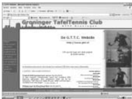
De website van GTTC ( www.gttc.nl )

Steenilstraat 7 Tel. 050-3124219 Fax 050-3122092 Groningen